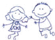
DÍTĚ (5-10 LET)

ČÁST 1: ZAMYSLI SE NAD TÍM, JAKÉ AKTIVITY TI DĚLALY RADOST NEBO TĚ ŠTVALY VE VYBRANÝCH OBDOBÍCH TVÉHO ŽIVOTA. ZAPIŠ JE DO TABULKY. POKUD SI NEMŮŽEŠ VZPOMENOUT, ZEptej se rodičů.