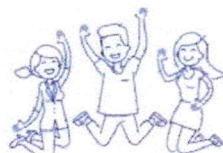
STARŠÍ DÍTĚ (10-15 LET)