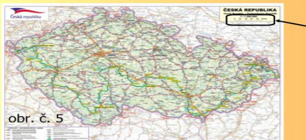
obr. č. 5