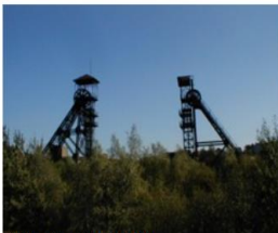
Těžba černého uhlí [2]