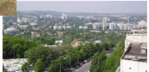
Kišiněv (Moldavsko) [22]