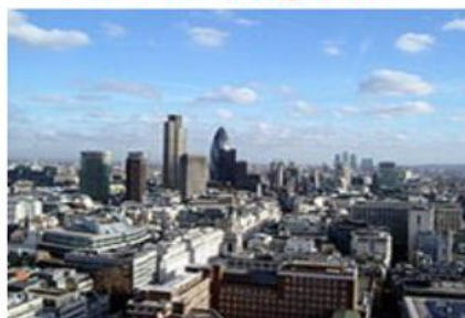
Londýn (Velká Británie) [13]