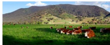
Chov skotu [7]