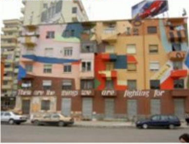
Rekonstrukce bytových domů v Tiraně (Albánie) [19]