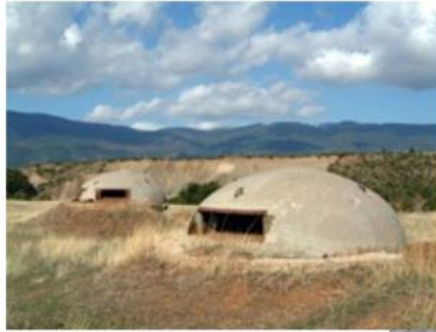
Bunkry z období socialismu (Albánie) [21]