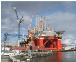
Vrtná souprava v Severním moři [1]