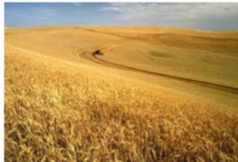
Pěstování pšenice [6]